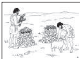
"CAIM E ABEL TRAZEM OFERTAS A DEUS"